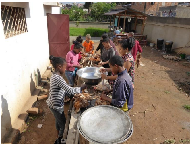
Zubereitung der frischen Poulets

Das Budget für die Reise mit den Schweizer Touristen war optimal berechnet. Mit der Restsumme durfte ich das Weihnachtsfest für die AEJT Kinder finanzieren (Ein grosses Dankeschön an die Teilnehmer der Reise!). Moments de joie et ambiance de fête pour les enfants. Die Kinder feiern das Weihnachtsfest im Zentrum und erleben fröhliche Momente. Es gehört zur Tradition, dass die Kinder an diesem Tag eine ordentliche Mahlzeit kriegen, sogar mit Fleisch. Vielleicht ist das der einzige Tag im Jahr, an dem die Kinder Fleisch essen können. Die Mahlzeit ist „poulet gasy aux petits pois“ (Malagasy, madagassische Spezialität), Poulet mit Erbsen und natürlich mit Reis. Das Essen wurde von einer Küchenmannschaft, bestehend aus elf Kindern und den vier Erzieherinnen zubereitet. Um 11:00 h kamen die übrigen Kinder ins Zentrum, insgesamt waren es 83. Das ganze Fest war hervorragend organisiert, keine leichte Aufgabe bei so vielen hungrigen Kindern.