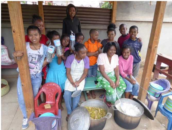
Die Küchenmannschaft vor dem Servieren