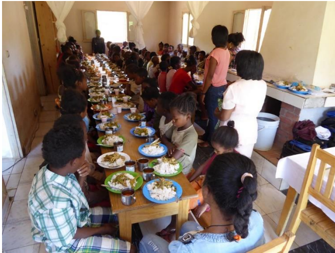
Das Essen ist bereit: Mazoto! Guten Appetit!