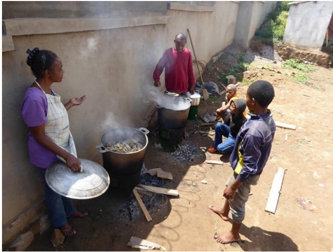
Die Kochtöpfe mit Poulet und Erbsen