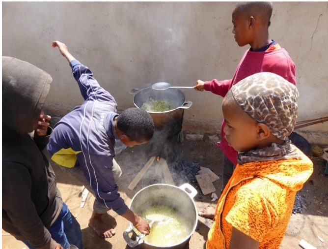
Die Erbsen werden dem Poulet beigemischt